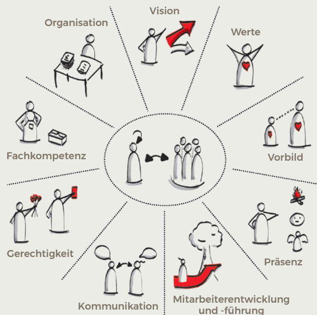
Abb.: 9 Leadership-Dimensionen