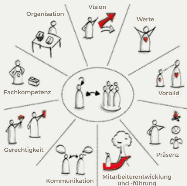
Abb.: 9 Leadership-Dimensionen